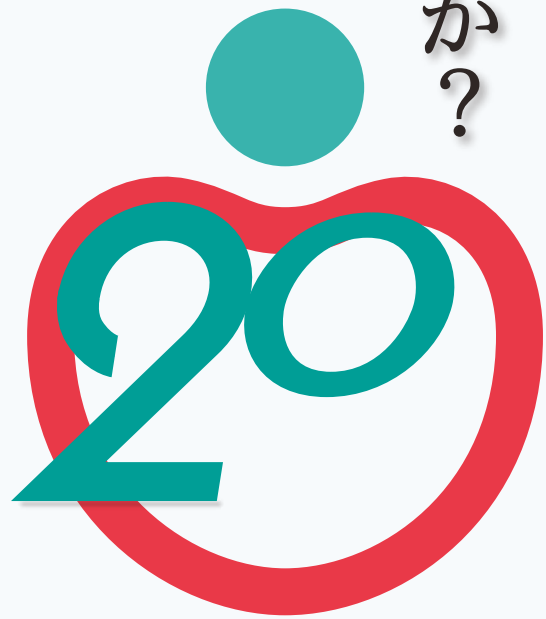
学会設立後のヘルスケアミーティングのフライヤー

私たちが、「医療は、いつの時代にあっても、常に医療を受ける人々の利益となることを第一義とし、人々の健康で快適な生活に貢献するものでなければならない。……人々にヘルスケアの新しいメッセージを届けたい。」という設立趣旨を掲げ、高い志を胸に、研究会を設立してから、早いもので今年で20年が経過します。この20年間に、私たちはいくつかの試練を経験し、様々な仕事をしてきましたが、同時に医療・保健環境の変化も一方ならめものでした。そこで、20周年となるヘルスケアミーティングは、①若い歯科医師・歯科衛生士の意識、②国民の口腔内状態の変化、③保険診療など医療制度の変化、を(A)実態調査を踏まえて客観的に捉え、それを(B)ヘルスケア歯科学会が積み上げてきた事実と対比的に検討した上で、(C)近未来のビジョンと志を示す企画とします。ことに、若い歯科医師、歯科衛生士の曰く言い難い悩みや不安を汲み取って、それを志高いヘルスケア歯科に昇華させることを目指します。