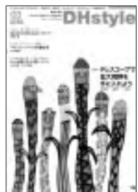
デンタルダイヤモンド社刊

特集は、テレスコープについてです。導入している医院も増えていますが、まだ導入していない医院も多く、その両方に役立つ情報・装置の解説や歯科衛生士業務での活用法まで丁寧に紹介されています。テレ