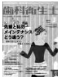
クインテッセンス出版刊

また、10月に横浜で行われる日本国際歯科大会や歯科衛生士シンポジウムの演者には印がつけられています。この雑誌で興味を持った医院や方がいたら、ぜひ横浜に足を運んでみてはいかがでしょうか? 関西ヘルスケア歯科談話会・スタッフミーティングのレポートも掲載され身近に感じる一冊です。