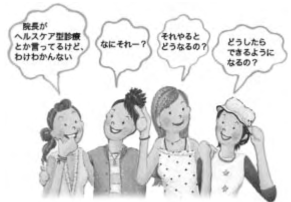
そんな疑問にお答えするのが、ステップアップセミナー

「知らない」を「わかった」に！ 「やってみたい」を「やる」に！ 「やっている」を「できている」に！ みんなでステップアップしましょう★