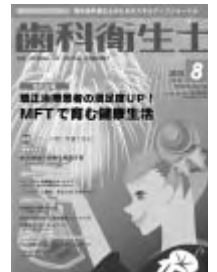
クインテッセンス出版刊

用の増進、ドライマウスの軽減、アンチエイジングなどの問題にも応用が可能であることを知ることができ、とてもひきつけられた内容でした。