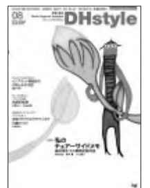
デンタルダイヤモンド社刊

その他興味をもったのが「インプラント周囲炎とその予防」です。インプラントを希望される患者さんも増えてきています。インプラント治療後のメンテナンスを行っていくうえでの歯科衛生士の役割の大きいこと、インプラント周囲炎に代表されるさまざまな臨床の問題についてどう対応するかなどに分けて、それぞれ解説されています。メンテナンスに活かせる内容でとても勉強になりました。