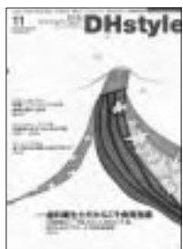
デンタルダイヤモンド社刊

私は DHstyle を読むときは「ハイジといっしょ」という記事もよく読みます。私自身も「こんなトラブルにあった」「こんなことを患者さんから言われて困った」と思うような、診療中に起こりうるトラブルへの対応法が書かれており、すぐ役立つ学びをいつも貰っています。新人