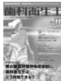
クインテッセンス出版刊

最も興味を持ったのは、電動歯ブラシについての記事です。最近、パナソニックのポケットドルツなど、コンパクトでかわいいデザインの電動歯ブラシが続々と発売されています。そんななかで、医院で取り扱っている電動歯ブラシの特徴は知っていても、他のものは…というのが私の現状でした。この記事のなかでは、それぞれの電動歯ブラシの特徴から価格まで書かれており、とても参考になりました。