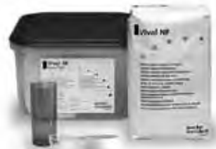
高精度アルジネート印象材 ピパール (Ivoclar Vivadent)

愛歯技工専門学校卒 モリタデンチャーインストラクター BPS 認定歯科技工士 JSOI インプラント専門歯科技工士 2011年 Defy 設立