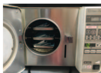
パッキングしてオートクレーブへ