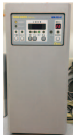
ホルホープデンタル