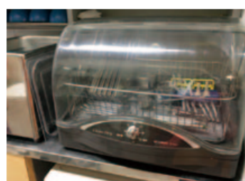
超音波洗浄の後、乾燥器でしっかり乾燥