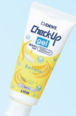
Check-Up gel (ライオン歯科材) 500ppm バナナ