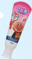
ライオンこどもハミガキ (ライオン) 500ppm いちご/メロン

パッケージ等はメーカーにより変更されることがあります(掲載は2023年1月現在)