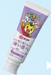
DoKoria こどもハミガキ (サンスター) 500ppm イチゴ/グレープ