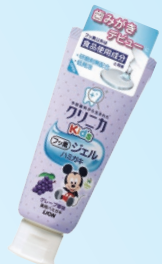
クリニカKid's ジェルハミガキ (ライオン) 500ppm グレープいちご