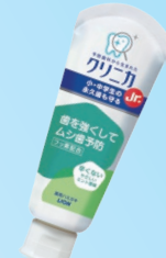
クリニカJr. ハミガキ (ライオン) 950ppm やさしいミント香味