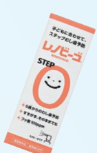
レノビーゴSTEP0 (ゾンネボード製薬) 100ppm