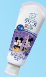
クリニカKid's ハミガキ (ライオン) 950ppm いちご/グレープ