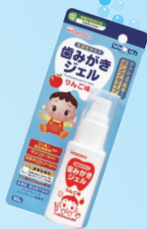
歯みがきジェル (アサヒグループ食品) 500ppm りんご/白ぶどう