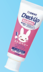
Check-Up kodomo (ライオン歯科材) 950ppm ストロベリー/アップル/グレープ