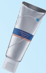
メルサージュ クリアジェル キッズ (松風) 500ppm ピーチ