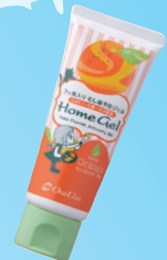
Home Gel(ホームジェル) (オーラルケア) 970ppm グレープ/ラムネ/ミント/ストロベリー ノーフレーバー/オレンジ