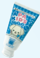
アパガードアパキッズ (サンギ) 無配合 ラムネ/グレープ