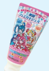
薬用ハミガキジェル (バンダイ) 500ppm いちご