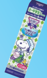
モンダミンJr. フッ素仕上げジェル (アース製薬) 950ppm グレープミックス