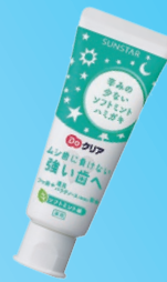
DoKoria こどもハミガキ (サンスター) 約1000ppm ソフトミント