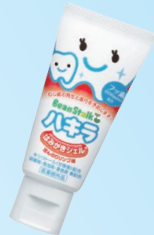
ビンスタークハキラ はみがきジェル (雪印ビンスターク) 500ppm ほんのりんご/ほんのりブルーベリー