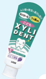
キシリデントライオン こども (ライオン) 500ppm ぶどう