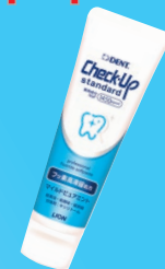
Check-Up standard (ライオン歯科材) 1450ppm マイルドビュアミント マイルドシトラスミント