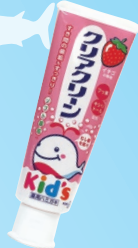
クリアクリーン キッズ (花王) 900~1000ppm以下 グレープ/メロンソーダ イチゴ