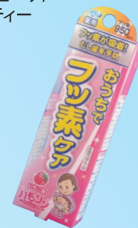
ハモリン (丹平製薬) 950ppm いちご/ぶどう