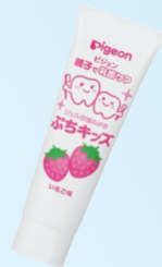
ジェル状歯みがき ぶちキッズ (ピジョン) 500ppm いちご/ぶどう キシリトールの自然な甘さ