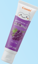
テテオ 歯みがきサポート 新習慣ジェル (コンビ) 500ppm グレープ/オレンジ/ストロベリー