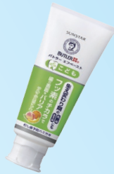
バター エフペーストこども (サンスター) 500ppm フルーツミント