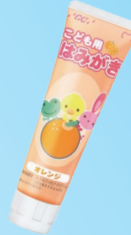
こども用はみがき (ジーシー) 900ppm アップル/オレンジ ストロベリー