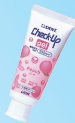
Check-Up gel (ライオン歯科材) 950ppm グレープ/ピーチ/ レモンティー