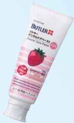
バター デンタルケアペーストこども (サンスター) 500ppm ストロベリー/グレープ