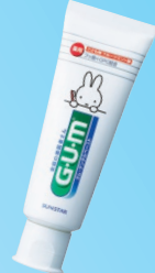
ガム・デンタルペースト こども (サンスター) 約1000ppm フルーツミント