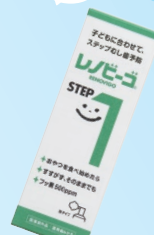
レノビーゴSTEP1 (ゾンネボード製薬) 500ppm